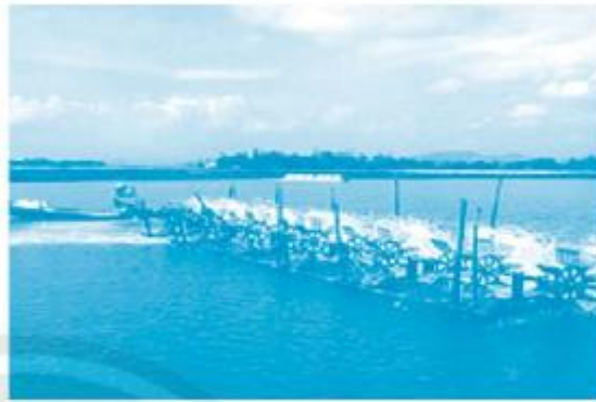
Hệ thống quạt nước trong đầm nuôi tôm