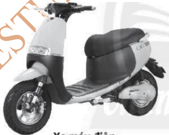
Xe máy điện

Câu 2.4. Ngày nay, người ta đã sản xuất nhiều xe máy điện để phục vụ đời sống của con người.